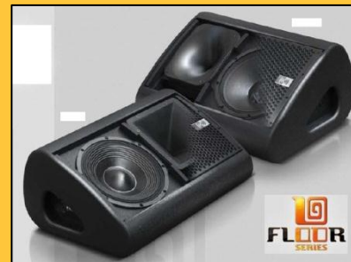
Monitor Floor Series