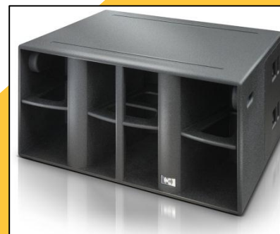
Sub Woofer MOL 1818